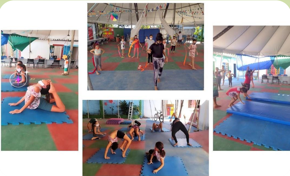
Atividade de circo